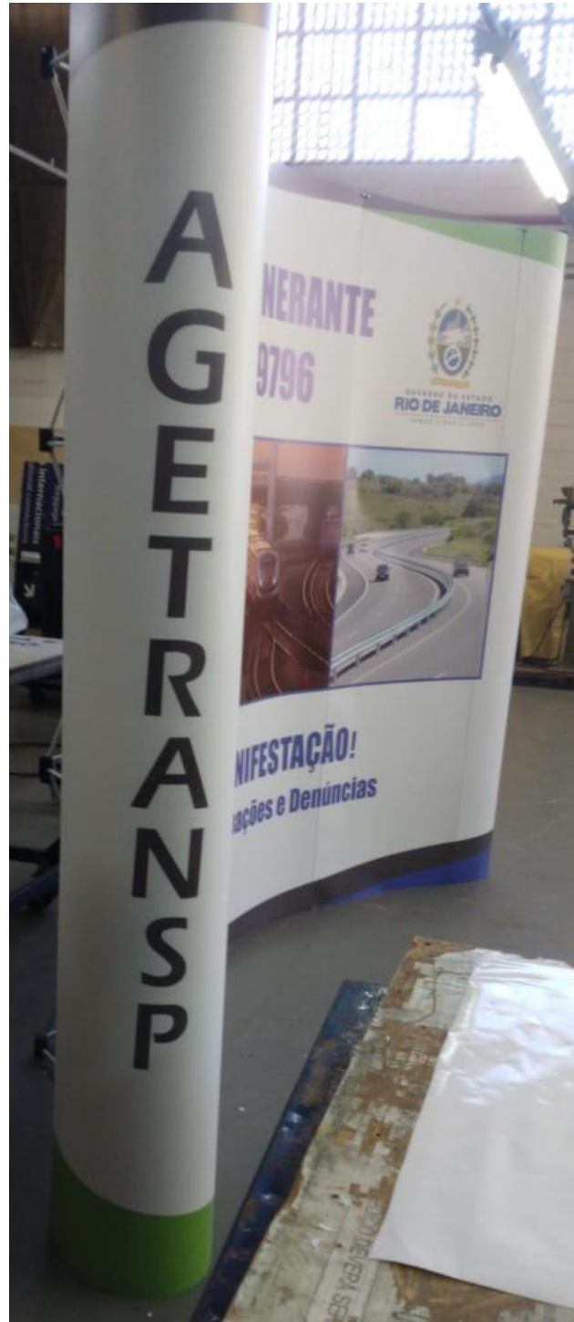
Painel Pantográfico (lateral)