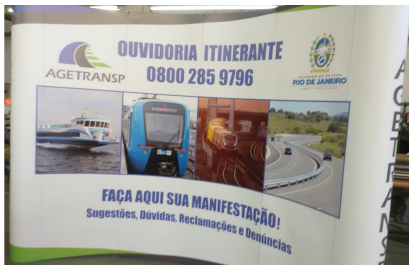
Painel Pantográfico 1