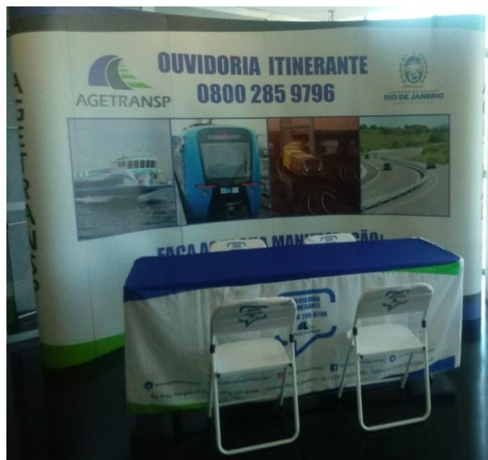
Estação de ouvidoria (Painel e recepção)